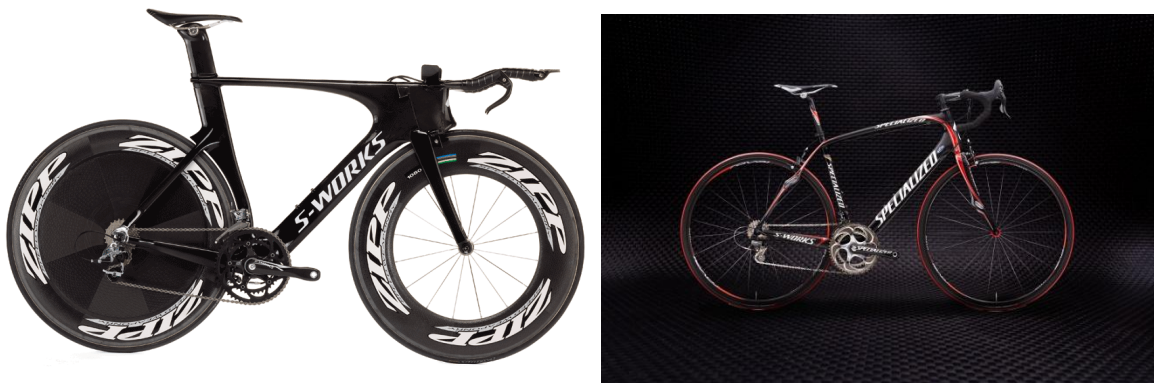
Slika: bicikl za dugi triatlon (lijevo) i bicikl za kratki triatlon (desno)

Postoje razlike između bicikala koji se koriste za utrke u kojima je zavjetrina dozvoljena i za utrke u kojima je zavjetrina zabranjena. U kratkom triatlonu (dozvoljena zavjetrina) se koriste klasični cestovni bicikli kao na utrkama biciklizma. Na utrkama dugog triatlona (zabranjena zavjetrina) se koriste bicikli koji su slični biciklima koji se koriste u biciklizmu na etapama kronometra. Međutim, bicikli za dugi triatlon i biciklistički kronometar se također u sitnim detaljima razlikuju.