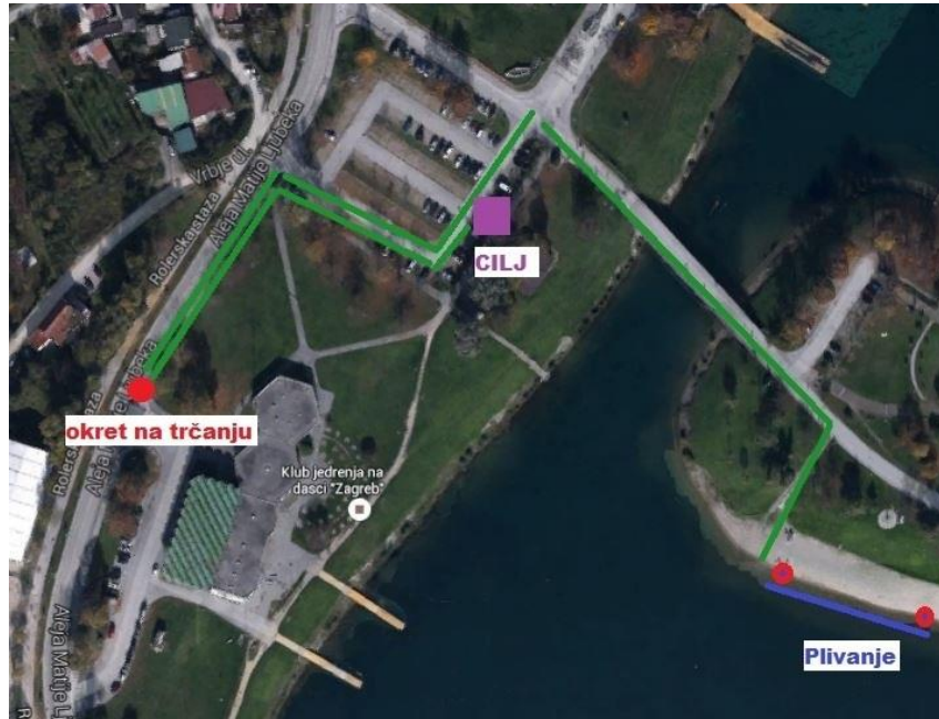
Akvatlon staza POČETNICI B - plivanje 100m, trčanje 500m

Trkački segment utrke: Početnici A trče 300m, Početnici B trče 500m.