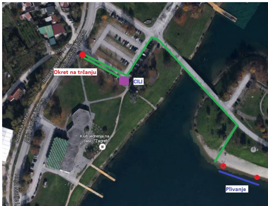
Akvatlon staza - 50m plivanje, 300m trčanje - Početnici A