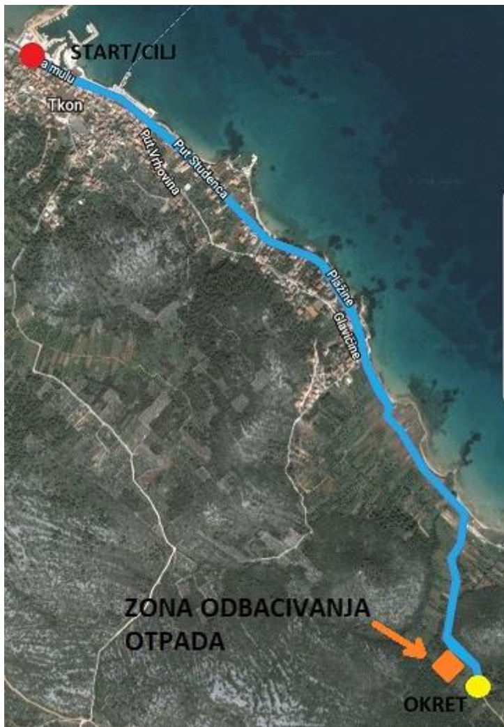
Slika 2 Trkački segment