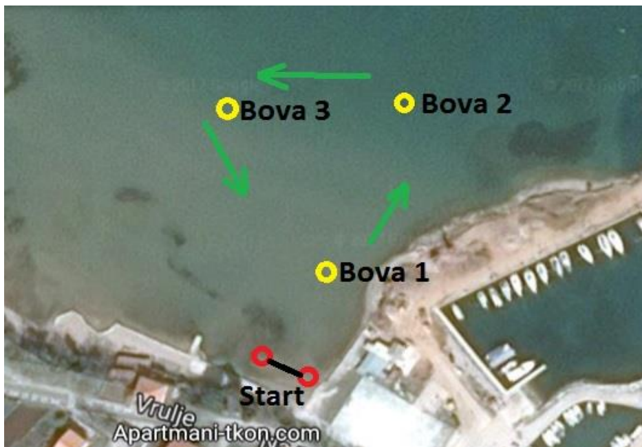
Slika 1 Plivački segment

Start je iz mora. Natjecatelji plivaju oko bova postavljenih u trokut u smjeru obrnutom od kazaljke na satu, sveukupno 1000 m.