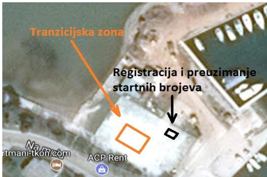
Slika 4 Tranzicijska zona i mjesto za registraciju i preuzimanje startnih brojeva