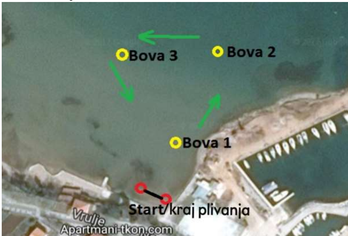
Slika 1 Plivački segment

Start je iz plitkog mora. Natjecatelji plivaju oko bova postavljenih u trokut u smjeru obrnutom od kazaljke na satu, jedan krug, sveukupno 1000 m.