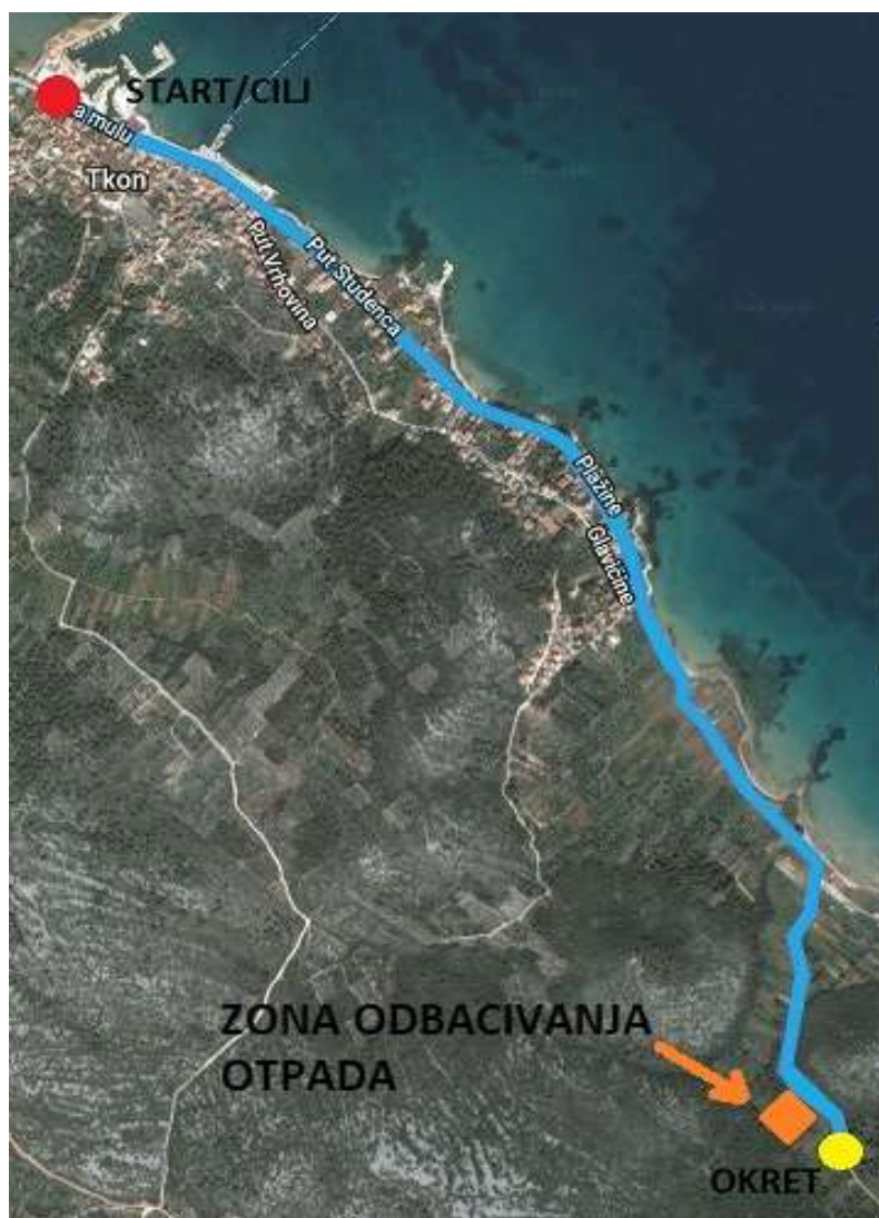
Slika 2 Trkački segment

Dio trkačkog segmenta odvija se kroz prirodu te je strogo zabranjeno namjerno odbacivanje bilo kakvog otpada (bidoni, vrećice od energetskih gelova i pločica itd.) izvan za to predviđene zone, koja se nalazi na okretu trkačkog segmenta. Uočeno odbacivanje otpada rezultirat će diskvalifikacijom natjecatelja iz utrke.